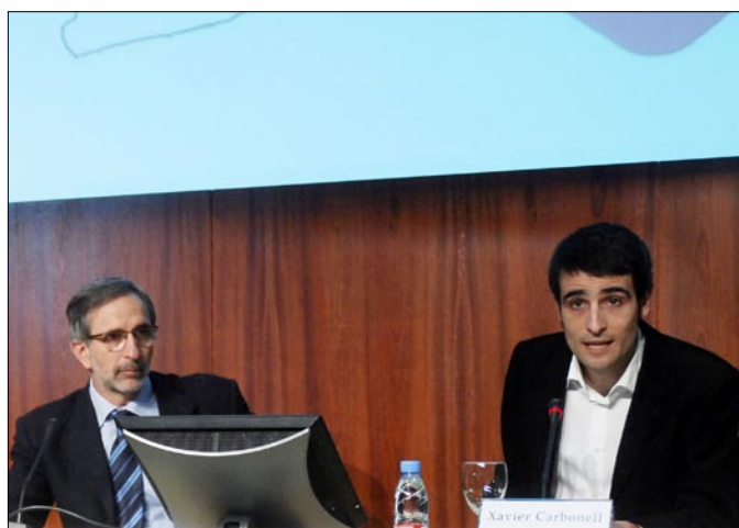
Josep Mayoral, president de l'AMTU i alcalde de Granollers, amb el regidor de Mobilitat de Vilanova i la Geltrú, Xavier Carbonell, durant la inauguració

El passat 12 de març va tenir lloc a Vilanova i la Geltrú la 4a jornada AMTU, que en aquesta ocasió va versar sobre infraestructures i mobilitat. Hi van ser presents més de 200 responsables polítics i tècnics i diversos agents relacionats amb la mobilitat.