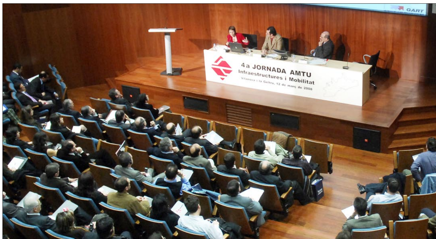
La sala es va omplir per escoltar les presentacions de la 4a Jornada AMTU