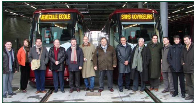
Els tècnics de mobilitat que van viatjar a Clermont-Ferrand

L'objectiu del viatge era veure el Translohr, un tramvia amb pneumàtics de nova generació que connecta el nord de la ciutat amb el sud. La línia