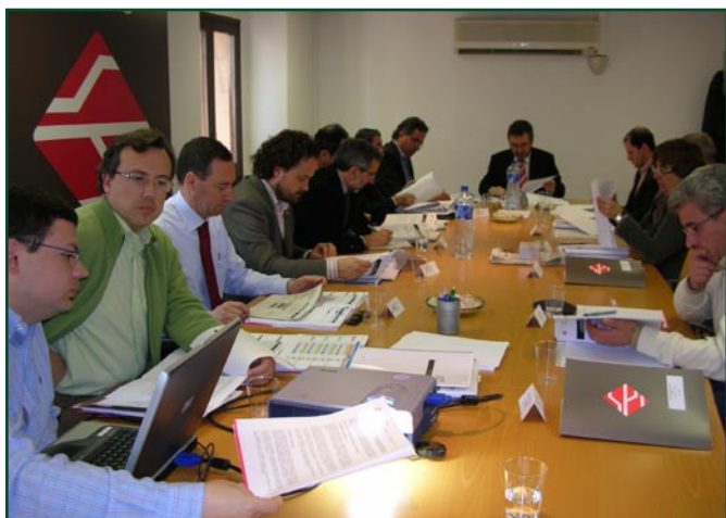
El document es va presentar en el darrer Comitè Executiu de l'AMTU

La importància d'aquest conveni recau en el fet que per primera vegada, en el Contracte-Programa en què es negocien els diners per al transport públic de la regió metropolitana, hi ha inclosos els municipis de la 2a corona adherits a l'AMTU.