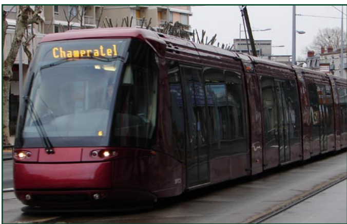
El tramvia circula sobre pneumàtics i està guiat per un rail central

Un cop observades les propietats del tramvia, els tècnics de mobilitat van considerar tenir-lo en compte per a futures aplicacions a ciutats mitjanes de Catalunya i indrets amb poblacions similars.